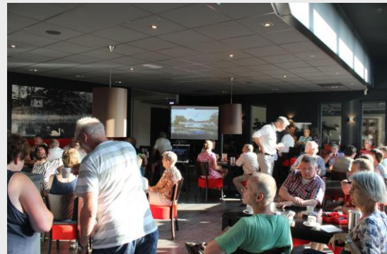
Gezellige drukte in de kantine van Betting Wonen tijdens de feestelijke opening.